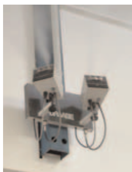
L'atomiseur haute pression TurboFog 16 dans la salle d'impression

L'imprimerie de la Halle, petite entreprise regroupant 14 collaborateurs, est spécialisée dans deux domaines : la production