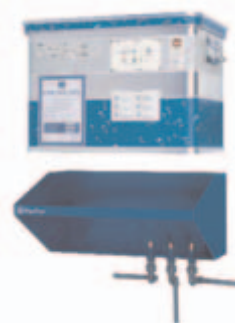
Le système DRAABE PerPur livre aux humidificateurs d'air et aux presses une eau d'une qualité optimale

Dans l'Imprimerie de la Halle, l'eau pure spécialement traitée par osmose inverse pour l'humidification de l'air DRAABE est en outre utilisée comme eau de mouillage standardisée pour les presses offset. « Ce double avantage rend le système DRAABE particulièrement intéressant », estime Patrice Pouillot. « Le pH reste constant et les réglages couleurs sont nettement plus rapides. Grâce à l'humidification de l'air DRAABE, nous avons pu nettement améliorer nos processus de production. »