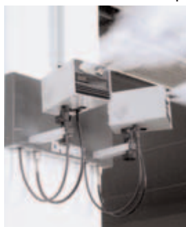
100% d'hygiène : DRAABE TurboFog 16

L'application de paraffine fait partie des techniques clés dans le domaine du