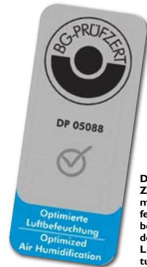
Das neue BG-Zertifikat „Optimierte Luftbefeuchtung“ hilft bei der Auswahl des geeigneten Luftbefeuchtungssystems

Die Beispiele aus Hamburg und Wien zeigen, dass eine Direktraum-Befeuchtung die heute gestellten Anforderungen an einen wirtschaftlichen und hygienischen Betrieb in vollem Umfang erfüllt. Hinsichtlich Wartungszugänglichkeit, Nachrüstung und gezielter Feuchteführung ist sie der Befeuchtung über raumlufttechnische Anlagen