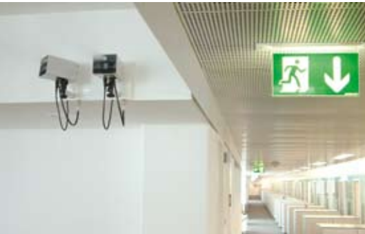
Bei Austria Tabak in Wien garantiert die Befeuchtung der Flure eine optimale Luftfeuchte in allen Büros