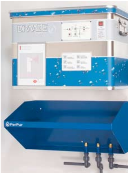
Kleincontainer für die Wasseraufbereitung und Hochdruckpumpe werden zur Wartung an den Hersteller geschickt

Für Roland Kretschmer und seine Kollegen war das leise Zischen der Hochdruckdüsen zunächst etwas ungewohnt: „Nach kurzer Zeit hat jedoch niemand mehr die Befeuchter wahrgenommen – jedes Telefonat ist schließlich lauter als die Betriebsgeräusche der kleinen Wandgeräte.“ Um einen funktionssicheren und hygienischen Betrieb der Befeuchtungsanlage zu garantieren, bietet der Hersteller ein umfassendes Wartungskonzept an. Sowohl die spezielle Wasseraufbereitung als auch die Hochdruckpumpe sind für eine unkomplizierte Wartung in tragbare Kleincontainer eingebaut, die zum Regelservice an die herstellereigene Laborwerkstatt geschickt werden. Dieser spezielle Service hat Roland Kretschmer von Anfang an überzeugt: „Wir bekommen