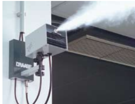
Hochdruck-Düsensysteme vernebeln speziell aufbereitetes Wasser mikrofein und nahezu geräuschlos