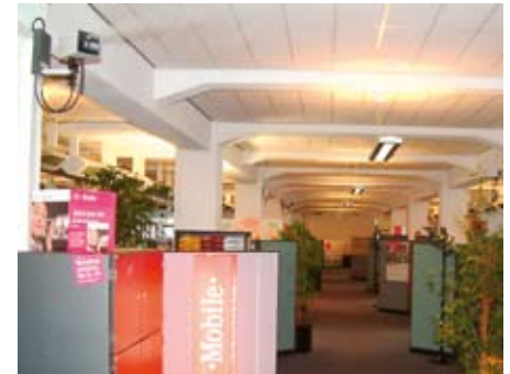
Die flexible Positionierung der Vernebler ermöglicht den Einsatz bei T-Mobile (Hamburg) trotz niedriger Decken

Luftbefeuchtung wird häufig nur mit Installationen in raumlufttechnischen (Klima-) Anlagen in Verbindung gebracht. Das Image ist vielfach geprägt von Hygiene-Problemen, hohem Wartungsaufwand und mangelhafter Leistung. Dass eine Direktraum-Befeuchtung nicht nur eine interessante Alternative zur herkömmlichen Luftbefeuchtung ist, sondern auch positiven Einfluss auf das Wohlbefinden im Büro hat, zeigt der Bericht über beispielhafte Anwendungen in Wien und Hamburg.