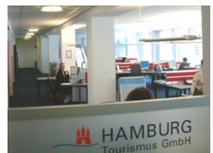
Sales & Service Center

Das Wichtigste: Meine Kolleginnen und Kollegen fühlen sich rundum wohl, Beschwerden über zu trockene Luft gibt es keine mehr.“